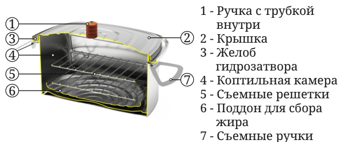
Рисунок 2. Общий вид и основные элементы коптильни

Из гарантийных обязательств исключаются детали, подлежащие естественному износу (защитные экраны, защитные гильзы, шамотный кирпич и т.п.). Гарантия качества на такие детали не распространяется (пункт 3 статьи 470 Гражданского кодекса Российской Федерации).